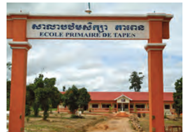
Ecole primaire (5 salles de classe, 12 toilettes): à Ta Pen les enfants suivent le programme national d'enseignement et reçoivent une éducation sanitaire.