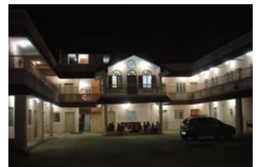
Les enfants handicapés des bidonvilles de Chennai ont enfin une institution spécialisée!