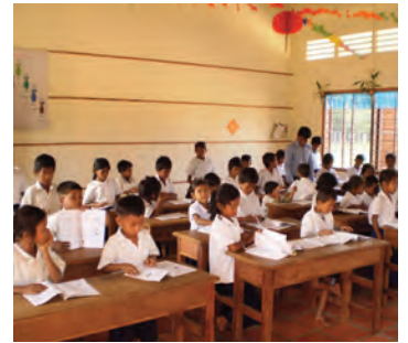
Enfants en classe: ils n'avaient jamais vu un livre de leur vie!

Un partenariat conclu entre la direction provinciale de l'éducation et le Don du Chœur permettra de construire au fil des ans la pérennité de cette école.