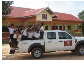
Grâce au pick up Ford, les enfants malades peuvent enfin être soignés au dispensaire, à 10 km de là!