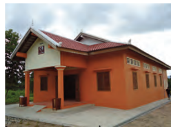
Maison des professeurs. Le directeur et certains professeurs habitent Siemreap et acceptent de vivre toute la semaine à Ta Pen!