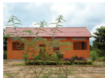
Maternelle. 40 enfants viennent à l'école le matin pendant que leur mère travaille dans les champs.