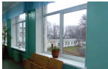
Chaudières, toiture, fenêtres, douches, lits, cabinet dentaire... 7 ans de rénovation!

Il faut dire aussi qu'une grande entreprise russe, Ahmad Tea, veille depuis deux ans sur le devenir de ces enfants, la pérennité du projet est donc enfin assurée.