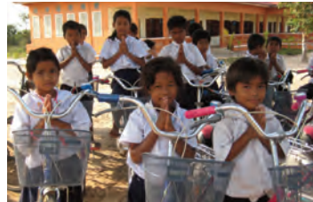
Vélos: L'assiduité des enfants à l'école est transformée depuis qu'ils ont leur vélo!

Un partenariat conclu entre la direction provinciale de l'éducation et le Don du Chœur permettra de construire au fil des ans la pérennité de cette école.