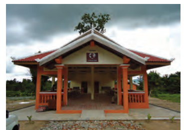
Cantine. Les petites bouches affamées y dévorent leur petit déjeuner le matin à 6h30.