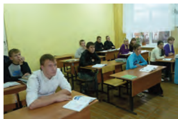
30% des enfants n'ont jamais quitté l'orphelinat depuis l'âge de 7ans!

Pour tous ces enfants, vos dons sont les bienvenus.