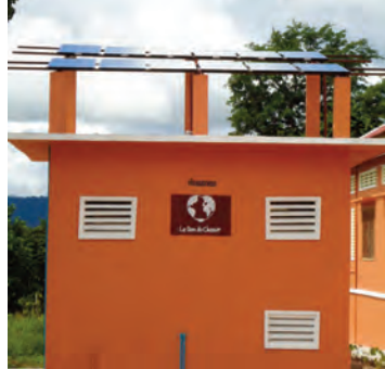
12 panneaux solaires. Et la lumière fût à Ta Pen!