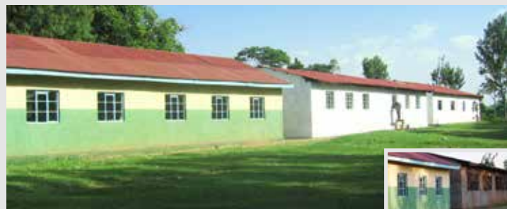
Toutes les classes de l'école de Kakemer sont désormais rénovées