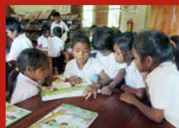
Ils ont deux heures de lecture par semaine!

autour de tables basses, les enfants lisent à voix haute leurs contes, romans, documents de culture générale ou environnementale. Un vrai trésor de connaissances que de généreux donateurs genevois ont mis à la portée de ces 400 enfants reclus en pleine forêt.