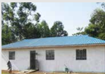
Le local administratif ouvrira en mars

Il y a un an, l'école spécialisée St Lukes ouvrait ses portes à 80 enfants en situation de handicap. Devant l'affluence d'élèves, le Département de l'Éducation nommait rapidement deux nouveaux professeurs et la salle initialement prévue pour l'administratif était progressivement libérée pour disposer d'une troisième salle de classe.