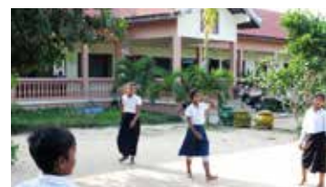
Le nouveau collège va changer leur avenir

avec les opportunités offertes par le nouveau collège, le nombre d'inscriptions a augmenté de 30%, passant de 305 à 400.