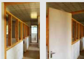
Chaque professeur aura son petit bureau

St Lukes va bientôt proposer un dortoir pour faciliter la vie des enfants et leurs familles. Il sera financé par le département du Nord Tésó. Bel engagement local dans l'éducation spécialisée!