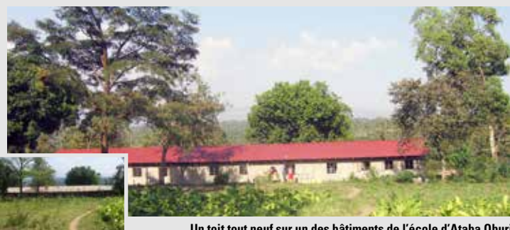
Un toit tout neuf sur un des bâtiments de l'école d'Ataba Oburi