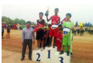
Bravo pour la Médaille d'Or de Basket de Siem Reap (section primaire) et bonne chance pour la Compétition Nationale!

Pour tous ces enfants, vos dons sont les bienvenus.