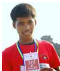
N°3 au Marathon d'Angkor