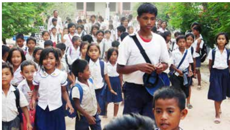
Sortie d'école des 400 enfants de Ta Pen

Cette explosion des inscriptions a des répercussions sur les frais de fonctionnement de l'école. Cela s'ajoute à la forte augmentation salariale décidée en 2014 par le Ministère de l'Éducation. C'est bien sûr positif pour le niveau de vie des professeurs mais cela fait partie des récentes difficultés rencontrées par le Don du Chœur pour gérer cette école!