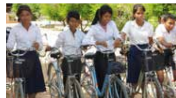
80 nouveaux vélos pour ceux qui habitent loin